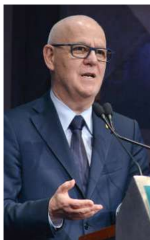
L'intervento del Questore di Milano Giuseppe Petronzi