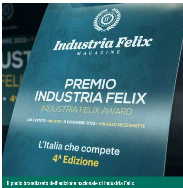
Il podio brandizzato dell'edizione nazionale di Industria Felix

S.P.A.. Rimini (1): Santa Monica S.P.A.. Modena (1): Salumificio Mec Palmieri S.P.A.. Piacenza (1): Steriltom S.R.L.. FRIULI VENEZIA GIULIA (4). Pordenone (2): Ambiente Servizi S.P.A., Gestione Servizi Mobilità S.P.A.. Trieste (2): Edizioni El S.R.L., Trieste Marine Terminal S.P.A.. LAZIO (24). Frosinone (2): Alpine S.R.L., Intermodaltrasporti S.R.L.. Latina (2): Ambroselli Maria Assunta S.R.L., Centro Servizi Ambientali S.R.L.. Rieti (1): Microdos S.R.L.. Roma (18): Acea Energia S.P.A., Arte Video S.R.L., Auxilium Società Cooperativa Sociale, CBI S.C.P.A., Clinica Valle Giulia Casa Di Cura S.P.A., EG Italia S.P.A., Geko S.P.A., Generale Costru-