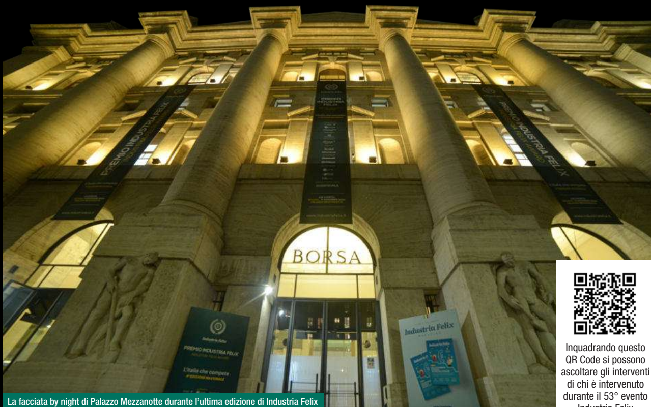
La facciata by night di Palazzo Mezzanotte durante l'ultima edizione di Industria Felix

L'11 dicembre scorso a Milano a Palazzo Mezzanotte sono state insignite dell'alta onorificenza di bilancio le aziende individuate dopo un'analisi condotta in collaborazione con Cerved su 689.790 bilanci. Rispetto al triennio 2021-2023 preoccupa invece la crescita dei mancati pagamenti in tre settori. Per la quarta edizione nazionale un parterre d'eccezione, in attesa degli eventi regionali che ripartiranno tra due mesi in occasione del decimo anniversario della manifestazione che porta alla ribalta l'Italia che compete