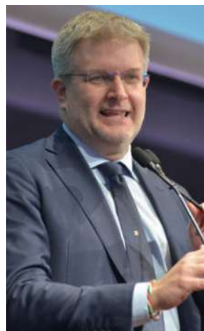
L'europarlamentare Carlo Fidanza