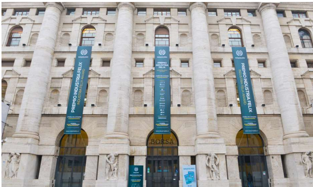
La facciata di Palazzo Mezzanotte a Milano in occasione dell'ultima edizione nazionale di Industria Felix

zioni Ferroviarie S.P.A., HT Film S.R.L., Leo 3000 S.P.A., Logistica Ambientale S.R.L., Nordex Italia S.R.L., O.M.S. Officine Meccaniche Segni S.R.L., Pepito Produzioni S.R.L., Porcarelli Gino & CO. S.R.L., SE.GI. S.P.A., Ultragas C.M. S.P.A., Villa Margherita S.P.A. Casa Di Cura Privata. Viterbo (1):