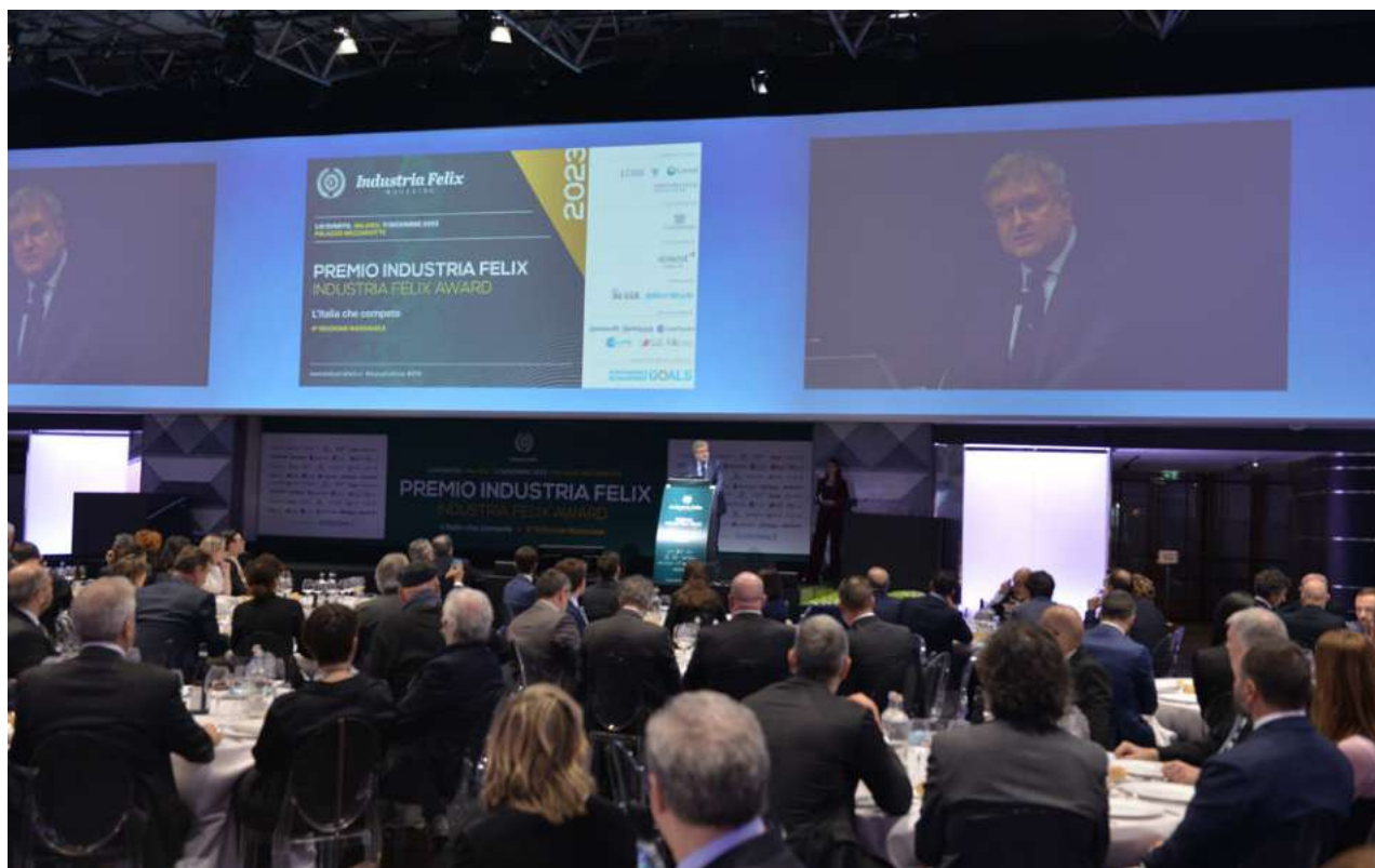
Una fase dell'edizione nazionale

Ceramica Cielo S.P.A.. LIGURIA (3) . Genova (2) : C Consulting S.P.A., Liguria Digitale S.P.A., Imperia (1) : Aurelia Car S.R.L.. LOMBARDIA (23) . Bergamo (3) : GAP S.P.A., Sandrini Metalli S.P.A., SIR - Sistemi Italiani Ristorazione - S.R.L.. Brescia (2) : Systema Ambiente S.P.A., Aeffe S.R.L.. Cremona (1) : Enercom S.R.L., Milano (13) : Autotorino S.P.A., Centro Cardiologico Monzino S.P.A., Coripet, Doubleyou S.R.L., Fracht Italia S.R.L., Gritti Capital S.R.L., Pellegrini S.P.A., Policlinico San Donato S.P.A., Siemens Healthcare S.R.L., Teva Italia S.R.L., UBV Group