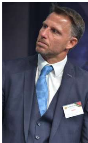
L'Ad di Cerved rating agency Fabrizio Negri